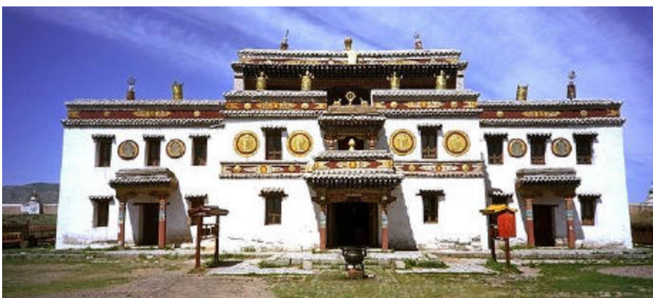
Visite du monastère.

De cette riche citée impériale, il ne reste que peu de traces, les briques ayant été utilisées pour la construction du temple d'Erden-Züü, sur le site exact de l'ancienne ville, la Karakorum actuelle, est située à quelques kilomètres de là. Les vestiges de cette énorme citée sont visibles tout autour du site et dans les collines alentour.